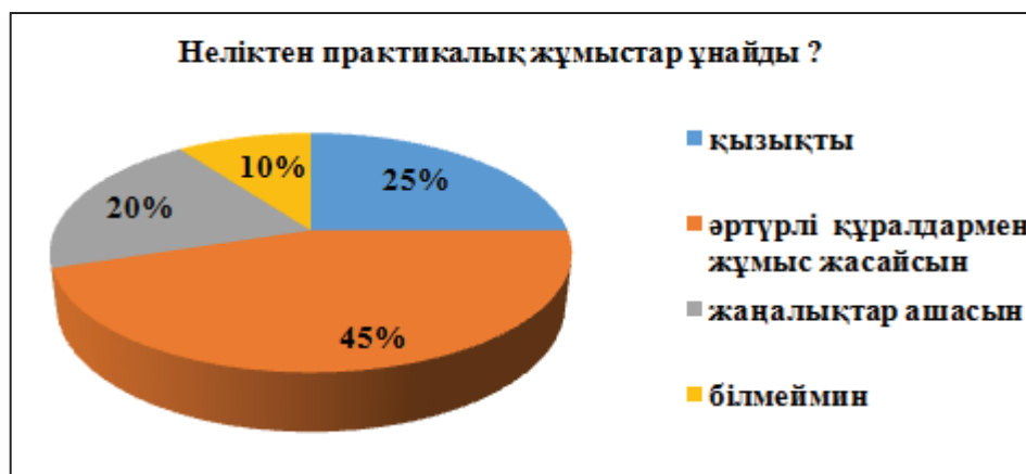
Диаграмма 5 - Неліктен практикалық жұмыстар ұнайды?

Кез келген дені сау бала үшін зерттеушілік, ізденімпаздық табиғатына тән құбылыс қой, сондықтан олар: практикалық жұмыстар жасау қызықты, зерттеуге болады, түрлі құралдармен жұмыс жасайсын, бір орында отырмайсың деген сияқты жауаптар жазды.