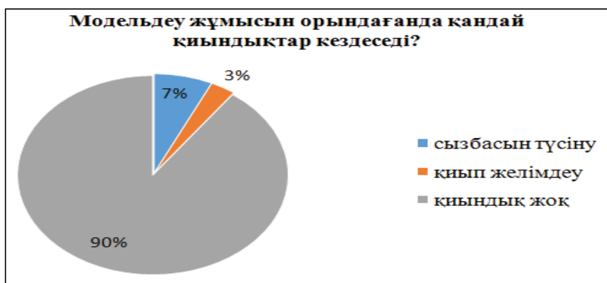
Диаграмма 3 - Модельдеу жұмысын орындағанда қандай қиындықтар туғызады?