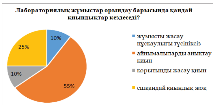
Диаграмма 4 - Лабораториялық жұмыстар орындау барысында қандай қиындықтар туғызады?

Сауалнама арқылы лабораториялық жұмыстарда оқушылар үшін қандай қиындықтар бар екенін білген соң, сол айнымалыларды қалай анықтауға болатыны