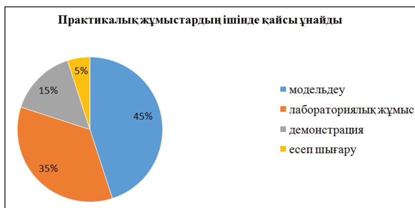
Диаграмма 1 - Практикалық жұмыстардың ішінде қайсысы ұнайды?

Сауалнама нәтижесі: Сауалнаманың нәтижесінен (Диаграмма 1) оларға әсіресе модельдеу ұнайтыны анықталды, содан соң егер модельдеуге тақырып ыңғайлы болса, моделдеу жүргізу жоспарланды. Мысалы IVтоқсанда «Вирустың құрылысы мен қызметі» және «Вирустың тіршілік айналымы бактериофаг мысалында» атты тақырыптарды модельдеу жұмысын жұппен орындауға тапсырылып,оқушылар аденовирус пен бактериофагтың модельдерін жасады.Сонда байқалғаны, олар жұппен біріге отырып қызыға кірісті, вирустың әр бөлігінің атауын және қызметін бір-біріне айтып отырды.