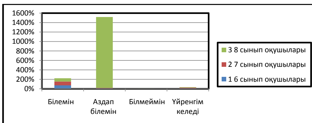
Сызба 3.13-15 жастағы оқушылардың допты тосқауылдай таласу техникасы

Футбол – атлетикалық ойын, жылдамдықты, ептілікті, төзімділікті, шыдамдылықты, күшті және секіргіштікті дамытады. Ойында футболшы жұмыстың ең жоғары жүктемесін орындайды, адамның функциялық жоғары деңгейдегі мүмкіншілік қабілетін, адамгершілік - жігерлі сапаларын тәрбиелейді. Футбол ойынының техникасын меңгеру және дағдылану оны жарыстарда жаттығуларда қолдана білу өте маңызды. Оны меңгеру, дағдылану, игеру әрбір жас футболшының дене қуаты дайындығына, жас ерекшеліктері мен морфо-функциялық, психологиялық ерекшеліктеріне байланысты болатындығын әр кез естен шығармағанымыз дұрыс.