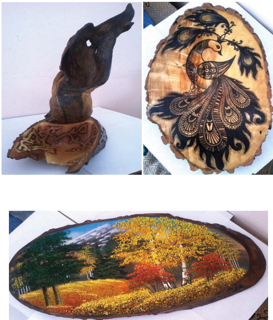
1-сурет. Ағаш діңінен жасалған әсемдік бұйымдар

тұрса, не сувенирлік бұйым ретінде үстел, жиһаздарда тұрса, тек қана әсемдік бұйым ғана емес, керекті құтыша ретінде де қолдануға болады. Сонымен, ағаш діңінен көптеген әсемдік бұйымдар жасауға болады. Олардың бір тізбегі 1-суретте көрсетілген.