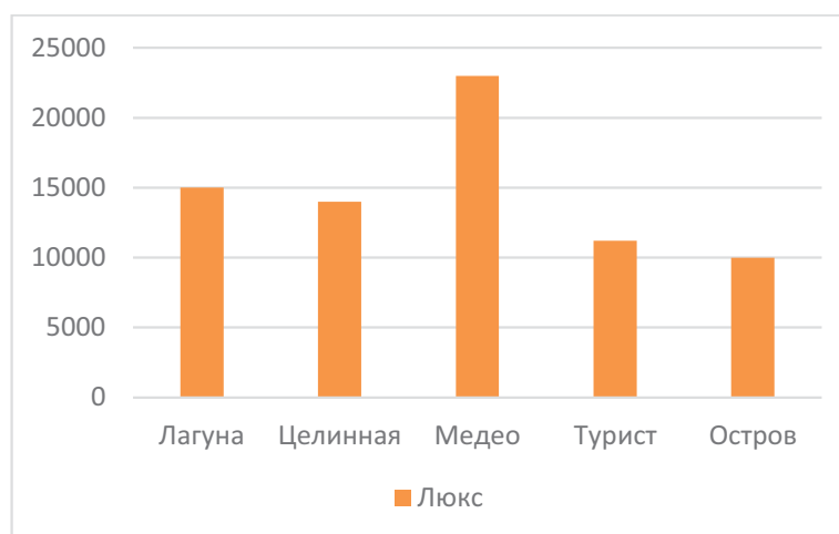
Таблица 3. Люкс номера