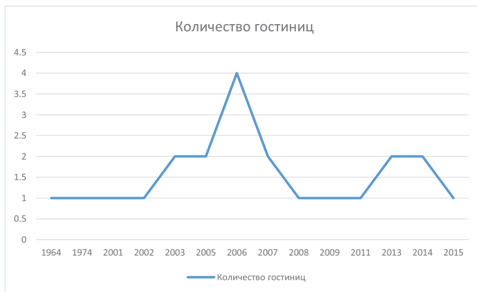
Диаграмма 1. «Строительство и ввод в эксплуатацию гостиниц города Костаная с 1964 – 2015 года»

Активное строительство гостиниц началось с 2001 года, и его максимум наблюдался в 2006 году (см. диаграмму 1). [4]