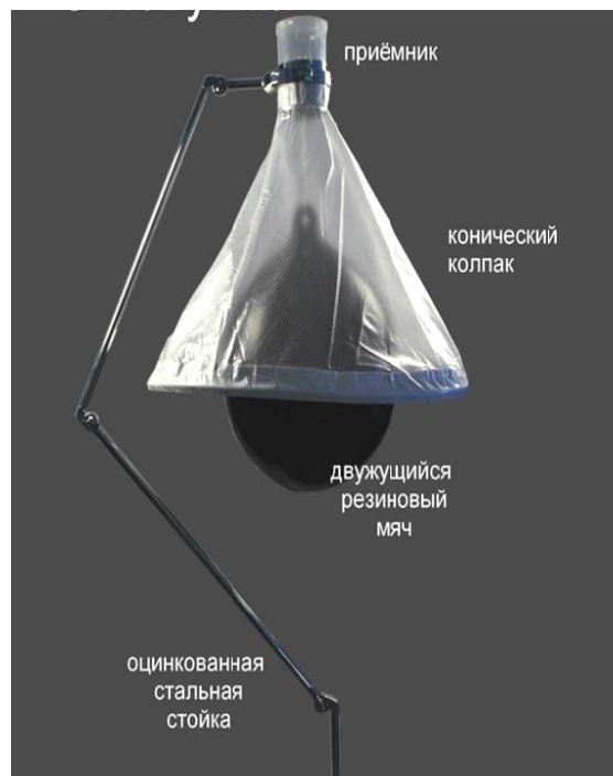
Рис. 3. Заводская С-ловушка для слепней

Принцип работы С-ловушки. Слепни по ошибке воспринимают черный, нагретый на солнце шар в С-ловушке как большое теплокровное животное и летят на этот шар. Когда они садятся на этот шар и исследуют "жертву", то пытаются ужалить его. После неудачной попытки они взлетают с поверхности шара. Слепни – вертикально взлетающие насекомые, они могут полететь только вверх. Ловушка разработана таким способом, что посредством конического колпака слепни направляются вверх к центру и собираются в приемник.