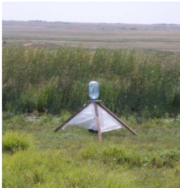
Рис. 4. Самодельная С-ловушка. Окрестности п. Караменды Наурзумского района Костанайской области.