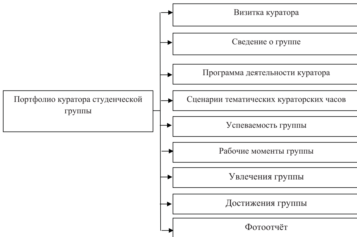
Рис. 2. Возможная структура портфолио куратора студенческой группы

Для того чтобы представить портфолио куратора, необходимо разработать структуру портфолио. Возможная структура портфолио представлена на Рис. 2 . Портфолио может включать наблюдения, фрагменты дневника куратора, фото-видеоматериалы, проекты и планы выступлений, разработки воспитательных мероприятий.