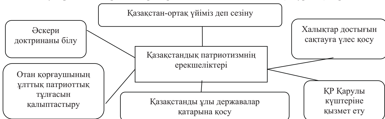
Сурет 1. Қазақстандық патриотизмнің мәні

Ұлттық қасиеттеріміздің ұрпақ бойында қалыптасуы қоғам игілігі үшін маңызды. Студенттерге ұлттық патриоттық тәрбие беру жоғары оқу орындарында кең көлемде жүргізілуі тиіс. Этнопедагогика – ұлттық тәрбие негізі деп білеміз. Ал ұлттық тәрбие ғаламдағы құндылықтарды бойына сіңіріп, өз құндылықтарын арттыра береді. Бірақ ол өндіріс және экономика сияқты «ғаламдастыруға» келмейді, өркениеттілікпен дамып, қалыптасады.