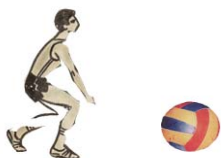
1-сурет. Тосқауыл қою.

Сондықтан дайындық уақытында тек қана техникалық әдістер емес, сонымен қатар тактикалық әдістерді үзбей жасап отыру қажет. Сонымен қимылға көңіл бөлу және алдын ала доптың қайда берілгеніне көңіл аудару қажет.