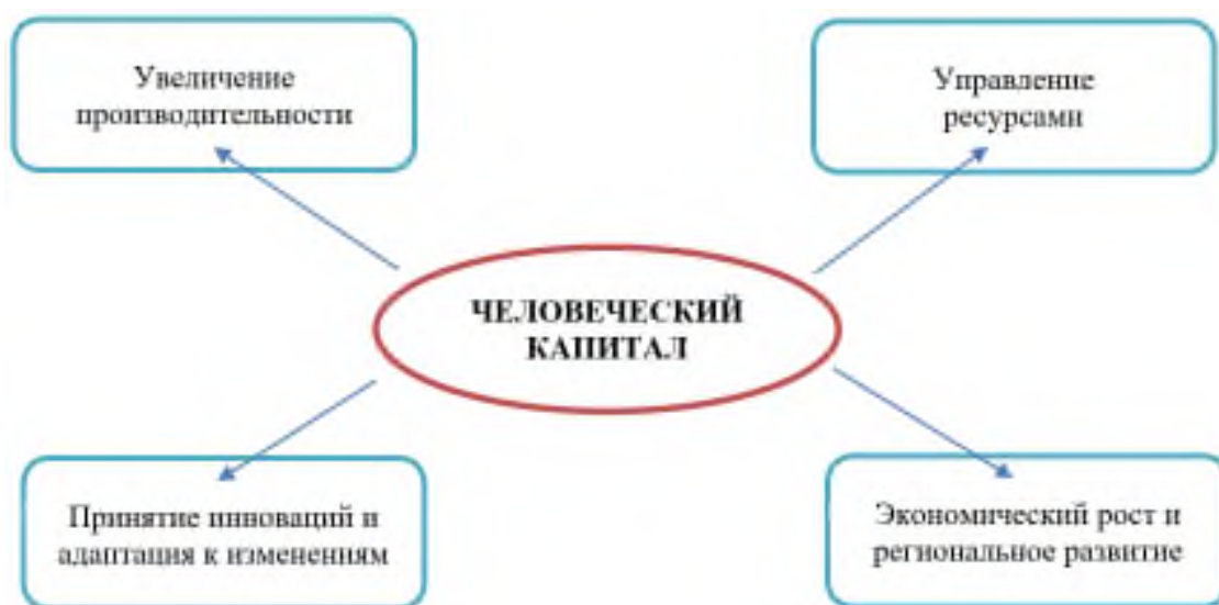
Рисунок 1 – Аспекты значимости человеческого капитала в сельском хозяйстве

Основные аспекты значимости человеческого капитала в сельском хозяйстве представлены на рисунке 1.