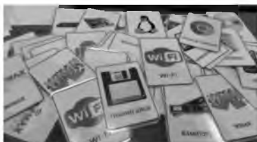
Рисунок 2 Игра «Словодел»

Игроки по очереди переворачивают по две карточки таким образом, чтобы все могли видеть изображенные на них картинки (рисунок 2). Если картинки на карточках одинаковые, то игрок забирает их. Он может продолжать игру до тех пор, пока он находит карточки с одинаковыми картинками. Если картинки на карточках не совпадают, то игрок кладёт карточки обратно картинками вниз и ход переходит к следующему игроку. Выигрывает тот игрок, который к концу игры наберет большее количество парных карточек.