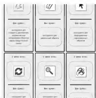
Рисунок 1 Игра «Мемо»

Правила игры: вам нужно выстроить цепочку из карточек или костяшек домино, чтобы одинаковые половинки соприкасались, мы ищем пары костяшек. (рисунок 1)