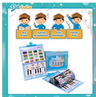
1–сурет. Bil-Bala интерактивті дыбысты кітапша

Bil-Bala – балаларға арналған интерактивті дыбысты кітапша – мектепке дейінгі және 1 сынып оқушыларына сай келетін 3 тілде (қазақша, орысша, ағылшынша) оқу, тыңдау, сызу, сөйлеу дағдыларын қамтиды. Ұсақ қол моторикасы дамиды (1–сурет). Үш тілдегі алфавитті меңгереді.