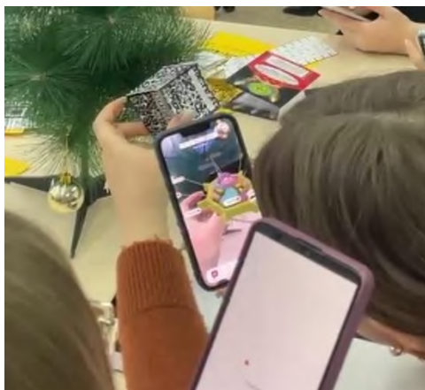
3–сурет. 3 D анимациялар

Joyteka –білім беру веб–квестін, интеллектуалды викторинаны, кері байланыс бейнелерін, терминдік ойындарды және "тест"білімді бақылау құралын құру қызметтері бар білім беру платформасы Бұл әдіс проблемалық оқыту мен ойын элементтерін біріктіреді, заманауи ақпараттық және коммуникациялық технологияларды белсенді қолдануды қамтиды. Бір бөлмеден іс әрекеттермен қатар, логикалық ойлау арқасында шығу.