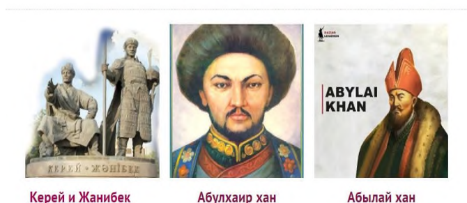
Схема 2. Систематизация направления «Исторические личности».

Применение индивидуальной работы с одаренными учащимися в течение года позволило проявлению познавательной активности, интереса к истории, повысило качество знаний по предмету, помогло в становлении самостоятельной и уверенной личности.