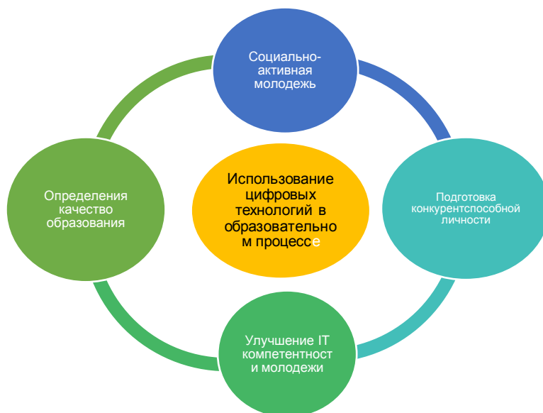
Рисунок 2. Цифровые технологии в образовании

Применение результатов и компонентов цифровизации (рис. 2) на практике позволит добиться большей эффективности, чем традиционные формы управления. Переход к цифровым технологиям – это построение совершенно нового типа общества и экономики, основанного на компьютерах и знаниях.