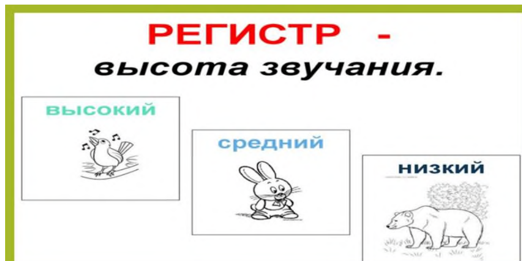
Рисунок 4. «Регистр»

Регистр – высота звука (домбра и кобыз – это всегда регистр средний, скрипка и флейта – чаще регистр высокий, контрабас, туба, фагот – регистр низкий).