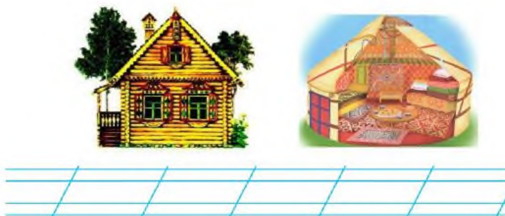
Рисунок 2. Пример задания из рабочей тетради

– задание на составление письма. Ученикам предлагается написать письмо на заданную тему, используя правильные формы приветствия, выражения благодарности и заключение. Например, «Письмо другу. Приглашение на день рождения». Это задание помогает развить навыки письма и структурирования текста. Задание на составление сообщения. Ученикам предлагается составить сообщение на заданную тему, используя простые предложения и ключевые слова. Например, «Сообщение о походе в музей. Дата, время, сбор, необходимые вещи». Это задание помогает развить навыки составления логичного сообщения и организации информации.