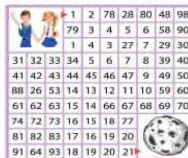
Рисунок 3. Пример задания из рабочей тетради

– Системный подход: Рабочая тетрадь предлагает задания, объединяющие различные аспекты языка и контекстуализирующие их. Это помогает детям понять, как язык используется в различных ситуациях, а также помогает им увидеть связь между различными аспектами языка.