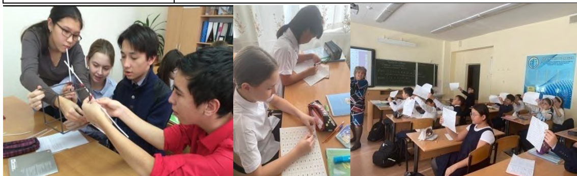
Рисунок 5. Фрагменты уроков–практикумов

На рисунке 5 показаны фрагменты уроков – практикумов, которые были проведены в разное время и с учениками разного возраста. Перечень аналогичных уроков из практики можно многократно продолжить. Ведется работа над составлением дидактического сборника практических и проблемно–ориентированных задач. Простота и оригинальность подачи материала, практическая значимость изучаемого материала определили мой выбор в пользу применения технологии применения критического мышления на уроках математики в преломлении через призму STEM – обучения. Содержание учебного материала усваивается обучающимися в процессе создаваемых проблемных ситуаций. Может когда–нибудь обо мне скажут– это STEM педагог.