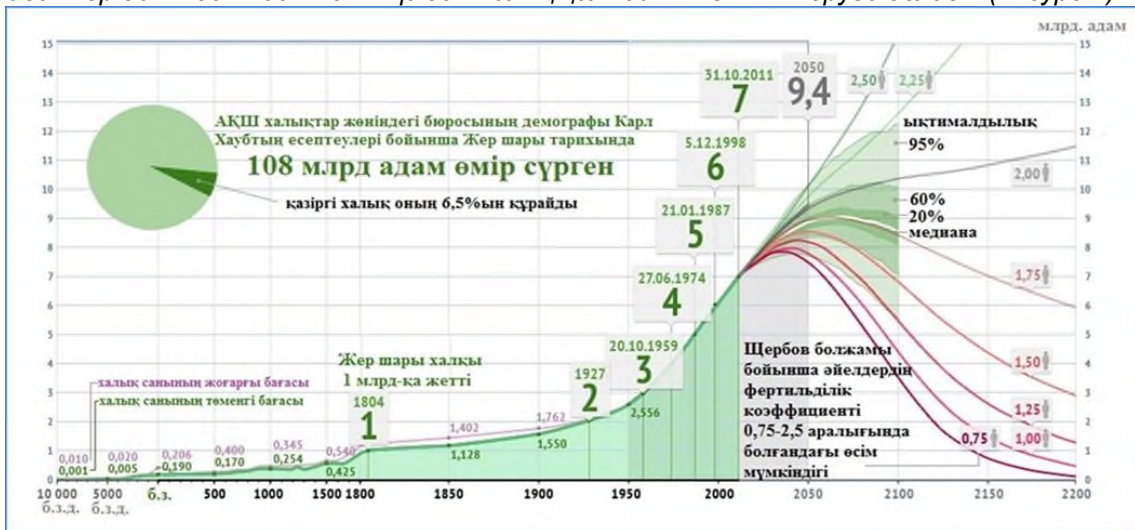
Сурет 1. Демографиялық көрсеткіштер.

Ал Карл Хауб Жер шарында осы күнге дейін 108 млрд адам өмір сүрген, және қазіргі халық оның небәрі 6,5%-ын ғана құрайды, сондықтан «демографиялық жарылыс» Жер шарына жүктеме салуы мүмкін емес деген тұжырымдаманы келтіреді. Ғалымның айтуы бойынша «егер дұрыс жоспарланған ауыл шаруашылығы болса, жоғарыда аталған барлық проблемалардың алдын алуға болар еді». Академик Щербов Жер шары халқының болашақта қалай өзгертіндігін де болжап берді. Егер де осы күнгі фертильділік коэффициенті сақталатын болса (2,25–2,50) 2100 жылы Жер бетінде 15 млрд адам өмір сүруі мүмкін. Бұл әрине өз кезегінде мәселені одан әрі ушықтыруы мүмкін. Ал егер фертильділік 2-ден төмендеп, 1,75-ті құраса, онда 2200 жылға қарай әлем халқы азайып, 6 млрд-қа жетеді. Ал, 0,75 коэффициент (қазіргі Сингапур елінің көрсеткіші) болған жағдайда Жер бетінде 2200 жылы мүлдем халық қалмайтындығын көруге болады (1-сурет).