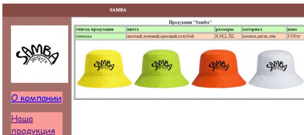
Сурет 4. Өнер пәні бойынша бизнес–жобалық сайт құру

Мектеп бағдарламасына информатика мен өнерді сәтті кіріктіру үшін екі сала мұғалімдерінің белсенді өзара әрекеттесуі қажет. Сабақтар мен жобаларды ұжымдық жоспарлау, тәжірибе мен идеялармен алмасу оқушылардың екі салада да қабілеттерін дамытатын үйлесімді білім беру ортасын құруға көмектеседі. [3]