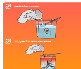
Рисунок 1. Фрагмент рабочего листа урока по теме «Растворение веществ в воде»

Другой пример, ученики играют в «Химический, морской бой». Ученикам на уроке по теме «Состав и строение атома», или «Структура периодической системы» дается STEAM-BOX (коробочка для работы на занятии), в которой находятся подручные средства и материалы для игры. В коробке имеется следующее оборудование и материалы: листы периодической системы химических элементов, маркеры разных цветов, карточки химических элементов. Таблицей для химического «Морского боя» является периодическая система химических элементов. Применяется такая игра довольно часто, можно менять тип задания в зависимости от конкретных целей, можно варьировать задания.