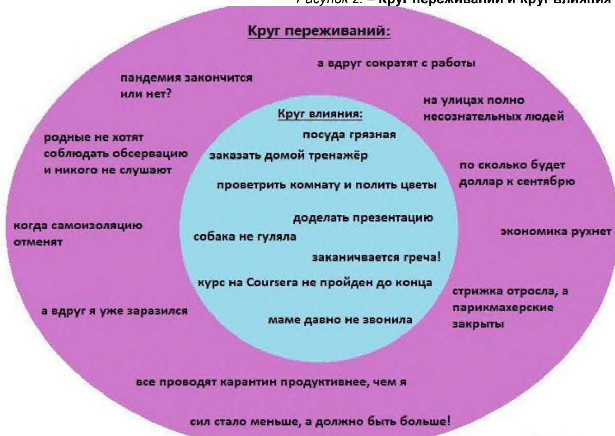
Рисунок 2. – Круг переживаний и Круг влияния

Когда педагог понимает, что он командный игрок, акцентируется на тех идеях, которые планируются или внедряются, ежедневно старается что-то внедрять в свою собственную образовательную практику, придерживается идеи японской модели преобразования школы «Ни дня без улучшений» – тогда это признаки круга влияния и оттуда можно легко выйти в трансформацию, изменение и развитие лично-профессиональной позиции и необходимых сегодня skills-компетенций и к формированию правильного отношения педагога к изменениям.