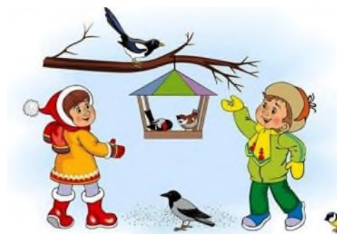
Сурет № 3

ә) насихаттайтын экокарточкалар «Табиғат әсемдігін сақта!», «Құс әніне құлақ сал!», «Құстарды аяла», т. б. (сурет № 3)