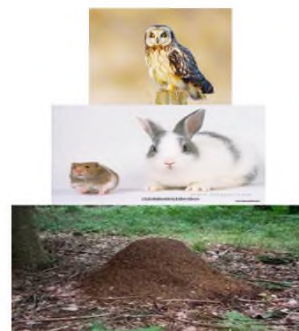
Сурет № 1

Бұл кітапшада «Кызыл кітапқа» енгізілген Қазақстан өңірінде кездесетін өсімдіктер мен жануарлар туралы, оларға қысқаша сипаттама беріледі.