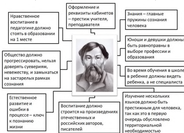
Рисунок 1. Основные принципы просветительских идей Алтынсарина

Алтынсарина и Кубеева мы создали наглядную схему основных принципов, которыми должен руководствоваться педагог, частично провели параллель с настоящими реалиями (рис. 1, 2).