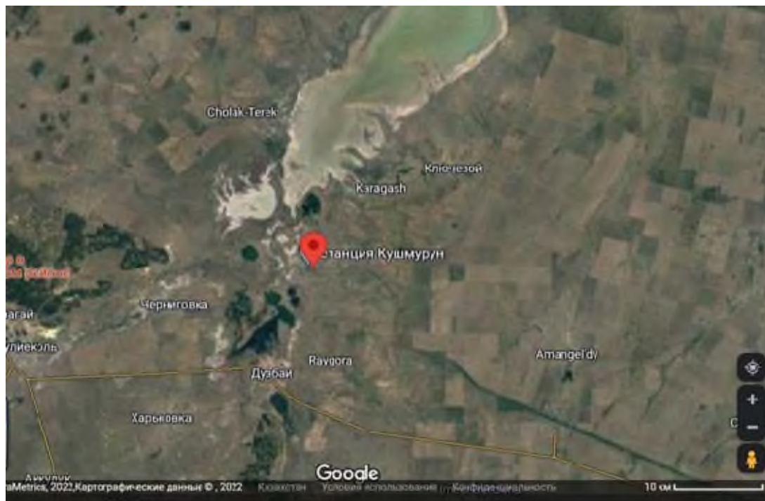
Рисунок 1 – Местоположение района работ. Аулиекольский район, Костанайская область

Материалом для данной работы послужили собственные энтомологические сборы, анализ литературных данных и статистическая информация Аулиекольского районного филиала Костанайской области Республиканского государственного учреждения «Республиканский методический центр фитосанитарной диагностики и прогнозов» Комитета государственной инспекции в агропромышленном комплексе Министерства сельского хозяйства Республики Казахстан. Полевые сборы на территории Аулиекольского района проведены в период экспедиционных работ в 2000-2015 гг. и в окрестностях п. Кушмурун 2017-2020 гг. (Рисунок 1).