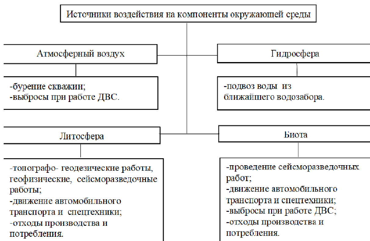
Рисунок 1 – Источники воздействия на компоненты окружающей среды

Несмотря на высокую эффективность и временный характер сейсморазведка оказывает негативное воздействие на окружающую среду и ее компоненты, поскольку происходит загрязнение горюче-смазочными материалами, производственными и твердыми коммунальными отходами. Источники воздействия на компоненты окружающей среды представлены на рисунке 1.