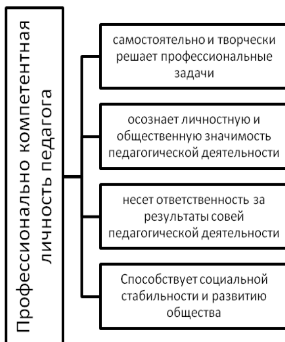
Рис. 1. Качества и свойства личности педагога

Именно педагогическое образование в конечном итоге определяет качество подготовки кадров для всех сфер функционирования общества и государства [2].