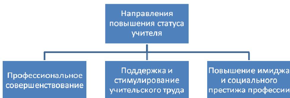
Рис. 1. Направления повышения статуса учителя в Государственной программе развития образования до 2020 г.

Казахстанский педагог – это учитель новой формации, являющийся духовно развитой творческой личностью, обладающей способ-