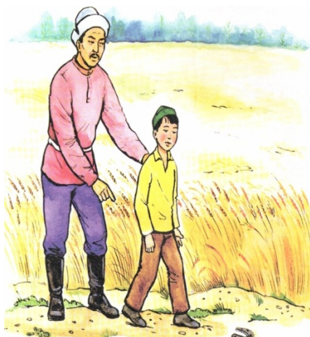
1-сурет. «Әке мен бала» әңгімесі. Сынық тағаға кез болу