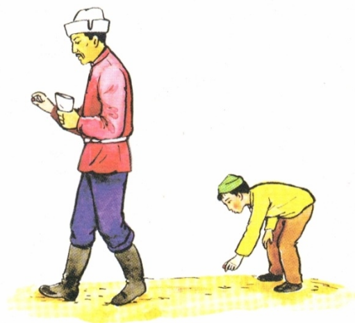
2-сурет. «Әке мен бала» әңгімесі. Жерден шие теріп жеу

«Баяндама» әдісі арқылы оқушы көрші оқушы берген жоғарыдағы суреттер бойынша «баяндама» жазады.