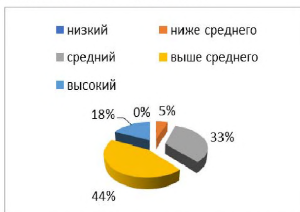
Рисунок 1 – Уровень самоорганизации студентов (методика Д.И. Ишкова)

На первом этапе экспериментальной работы были проведены психодиагностические методики, результаты которых позволили выявить уровень временной компетентности студентов. По методике А.Д. Ишкова «Диагностика особенностей самоорганизации» были получены результаты, которые представлены на рисунке 1.