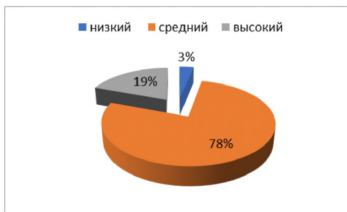
Рисунок 2 – Общий показатель дезорганизации

Общий показатель дезорганизации у большинства студентов средний (77%). Эти показатели говорят о хорошем умении организовывать свое время, однако 19% имеют трудности, которые определяются отдельными шкалами данной методики. Результаты методики О.В. Кузьминой «Диагностика личностных дезорганизаторов времени» представлены на рисунке 2.