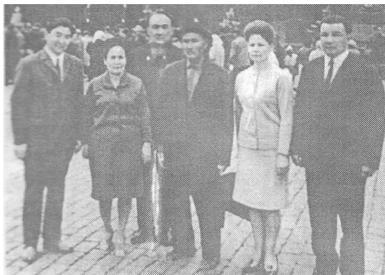
Москва. Красная площадь. 1969. После защиты докторской диссертации

Активно участвует Козыбаев и в становлении массового исторического сознания, как одной из основ демократического общества. В этом плане его энергия как общественного деятеля направлена на идейное противостояние, как имперским стереотипам постсоветского мышления, так и крайним формам казахского национализма. Публичные выступления в средствах массовой информации и участие в политических дискуссиях обнаруживают в нем яркого поборника идей нового евразийства, как полиэтничного сожительства с равными возможностями и терпимыми взглядами.