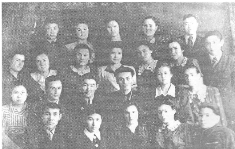
Студенты биолого-химического факультета Костанайского государственного учительского института. 1957 год.