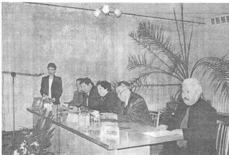
Петропавл қ. 2001 ж. Қожаберген жырау мерейтойына арналған ғылыми-теориялық конференция