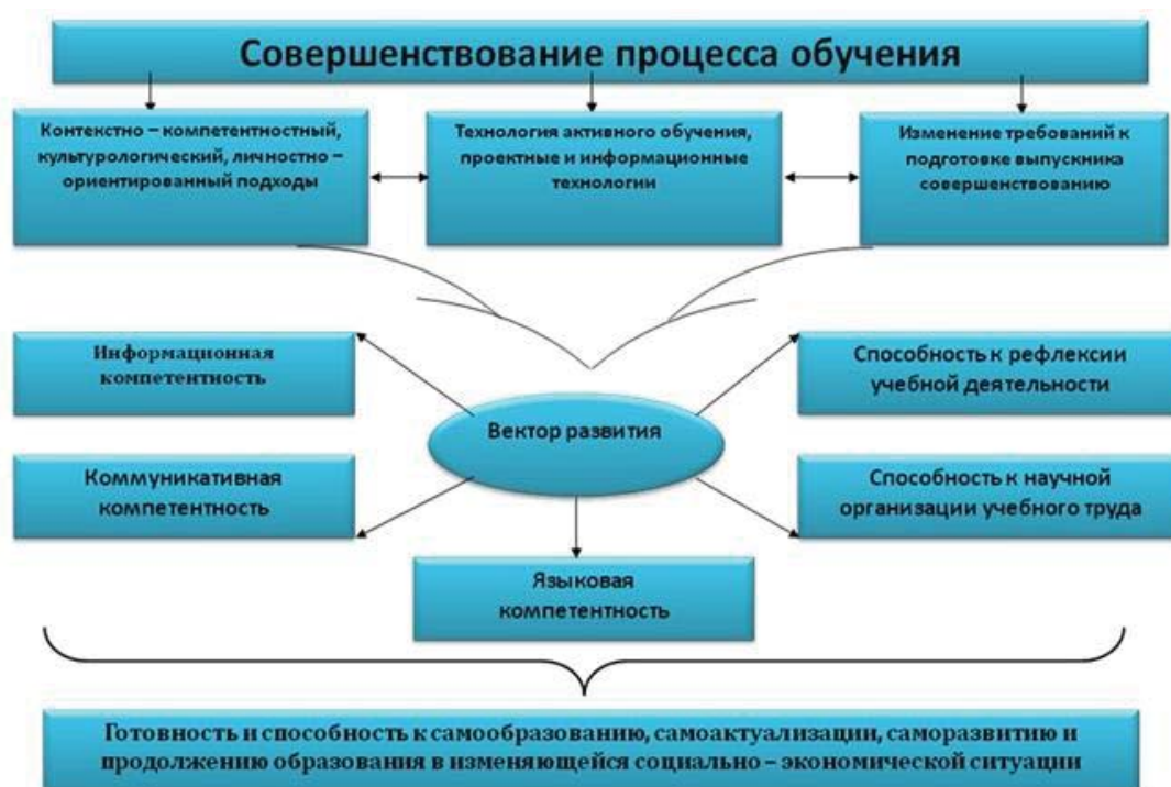
Схема №1 Совершенствование процесса обучения

В качестве элементов личностного потенциала Д.А. Леонтьев выделяет способность к сотрудничеству, коллективной организации и взаимодействию (коммуникативный потенциал); творческие способности (творческий потенциал); ценностно-мотивационные свойства (идейно-мировоззренческий и нравственный потенциал) [4].