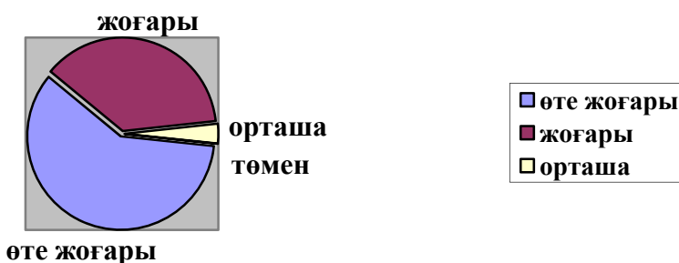
Сурет 1 – Сұрақтардың нәтижелері

Анықтамадағы алдыңғы қатарлы орынды «Ұстамдылық, сабырлық» (3-курс) және «төзімділік» (4-курс) ұғымдары иеленген (Сурет 1). Орыс тілінің сөздігі аталған ұғымдарға келесідей түсініктеме береді: