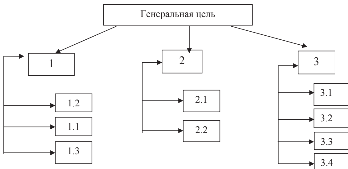
Рис. 1. «Дерево целей» формирования межличностных отношений у детей старшего дошкольного возраста с нарушением зрения

Целеполагание – это первым этапом процесса метода моделирования. Основой деятельности целеполагания в процессе формирования межличностных отношений старших дошкольников с нарушением зрения, является этап построения иерархии взаимосвязанных, взаимообусловленных и взаимоподдерживаемых целей, иначе говоря – построение «дерева целей». В рамках теории обучения, представленный термин был введен Б.С. Гершунским. Как метод планирования, «дерево целей» основывается на теории графов и представляет, как траекторные, определяющие направление движения к заданным стратегическим целям, так и точечные, определяющие достижения тактических целей, характеризующиеся степенью приближения к заданным целям по заданной траектории. Представим «дерево целей» процесса формирования межличностных отношений старших дошкольников с нарушением зрения (рис.1).