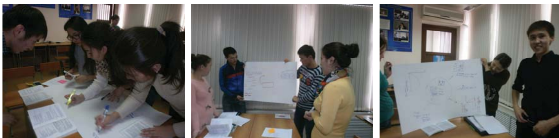
Сурет2. Топтардың постер қорғау сәті

Бөлінген тапсырмаларды толықтай және тиімді орындау үшін, топтар шағын болу керек. Сондықтан студенттерді 1 ден 3 дейінгі сандар жазылған әртүрлі стикерлер бойынша топтарға біріктіріліп, өз сұрақтарын талқылады, ортақ постер жасады. Әр топ постер қорғады. Қателіктерін түзеді.