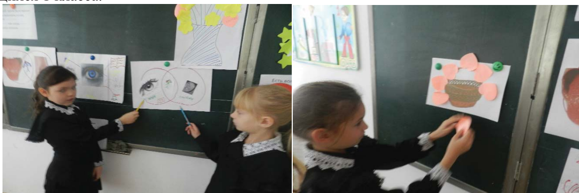
«Диаграмма Венна» «Корзина идей»

Эффективные приемы критического мышления, способствующие развитию речи у учащихся 1 класса.