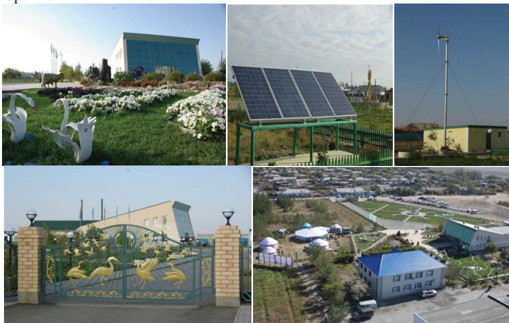
Рис. 4. Визит-центр Наурзумского заповедника

блага. Надо только правильно пользоваться. Наурзумский заповедник стал примером рационального использования природных ресурсов: энергии ветра и солнца. Сквер у визит-центра заповедника освещается за счет электроэнергии, вырабатываемой этими генераторами.