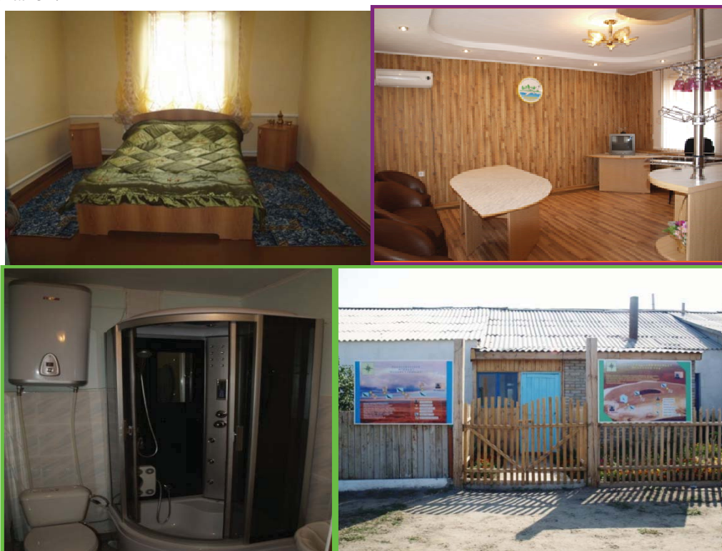
Рис. 3. Гостевые дома, обслуживающие посетителей Наурзумского заповедника

2 гостевых дома имеют стандарт золотого качества, 1 – стандарт серебряного качества (Рис. 3). Приобретены разговорники на 3-х языках, разработанные туристской организацией. Развитие экологического туризма в Наурзуме включено в международный каталог.