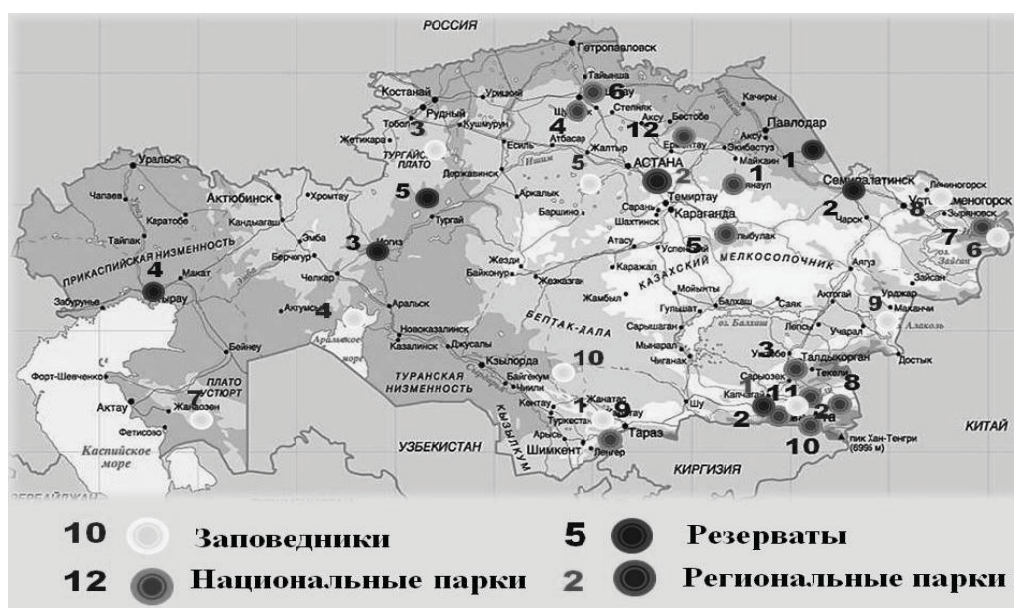
Рис. 2. Карта государственных особо охраняемых природных территорий высшей категории Республики Казахстан

Государственный природный резерват – особо охраняемая природная территория со статусом природоохранного и научного учреждения, включающая наземные и водные экологические системы, предназначенная для охраны, защиты, восстановления и поддержания биологического разнообразия природных комплексов и связанных с ними природных и историко-культурных объектов.