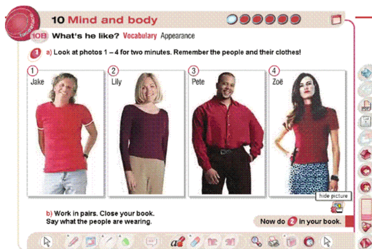
Рис 2. Вид экрана урока «Mind and Body – Appearance»

На примере урока «Mind and Body - Appearance» из кембриджского курса Face 2 Face, в CD-версии «для использования с интерактивной доской» демонстрируется несколько типовых приемов использования интерактивной доски в обучении иностранным языкам.