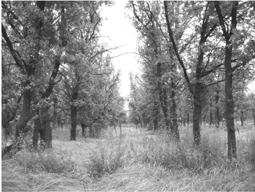
Рис. 1. Общий вид дубового массива на лугово-каштановых почвах

Однако признаки распада присутствуют и здесь. Сомкнутость между рядами деревьев не превышает 0,5–0,6. 17–54% деревьев имеют здоровый внешний вид и широкие живые кроны, 46–83% – активно суховершиняют или усохли (рис. 2). Прекращение агротехнических уходов в широких междурядьях привело к буйному развитию злаковых трав, в депрессиях рельефа с интразональными почвами – к поселению в них ксеро-мезофитных аборигенных кустарников (терна, жостера). Это отрицательно отразилось на водном балансе древостоя, ускорило его старение (до 42 лет древостой активно растет, после прирост, как в высоту, так и в толщину, резко снижается (пр. пл. 1, рис. 3)).