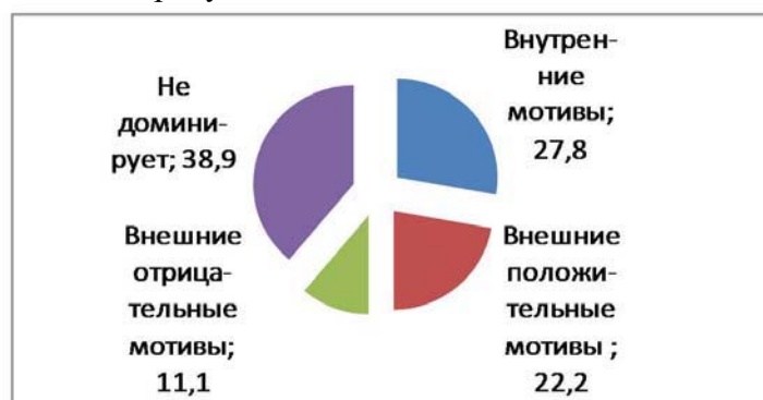
Рис. 1. Процентное соотношение внешних и внутренних мотивов в 1 Б классе

Графически процентное соотношение испытуемых с определенными мотивами учебной деятельности представлено на рисунках 1–3.