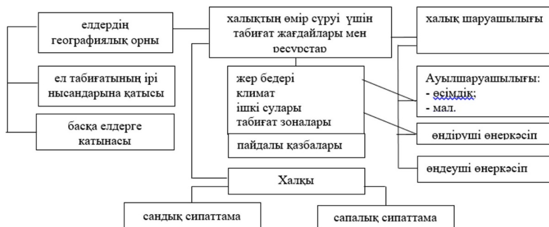
Сурет 1 География курсына қалыптасқан кешенді елтану дағдыларының ескі жүйесі