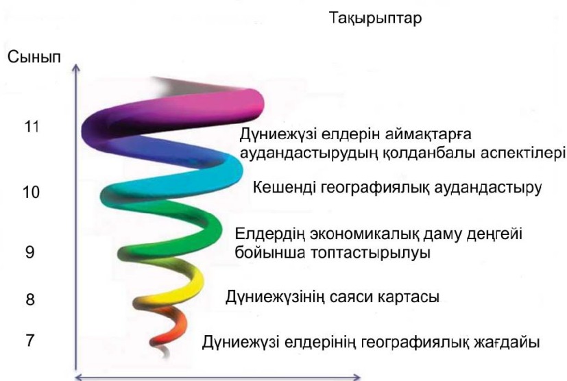
Сурет 3 «Елтану» бөліміндегі «Дүниежүзі елдері» тақырыбының шиыршықтық әдіспен берілуі

Елтану география ғылымының бір саласы болғандықтан оның да зерттеу нысаны ауқымды және кешенді болуы қажет. Егер де тұтастай бір бөлімді алып қарастыратын болсақ, талқылау аясы ұзаққа да созылуы мүмкін. Барлығы да түсінікті болуы үшін біз, аталмыш бөлімдегі бір тақырыптың қалай шиыршықтық әдіспен сыныптан сыныпқа жалғасатынын, төрт жылдан астам уақыт ішінде осы бөлімнің алғашқы тақырыбы мысалында ол қалай оқушыларға меңгерілгендігін, яғни оқу мақсаттары қалай бағындырылғандығын, педагогтер оны қалай жүзеге асырғандығын мысал ретінде қарастырамыз (сурет 3).