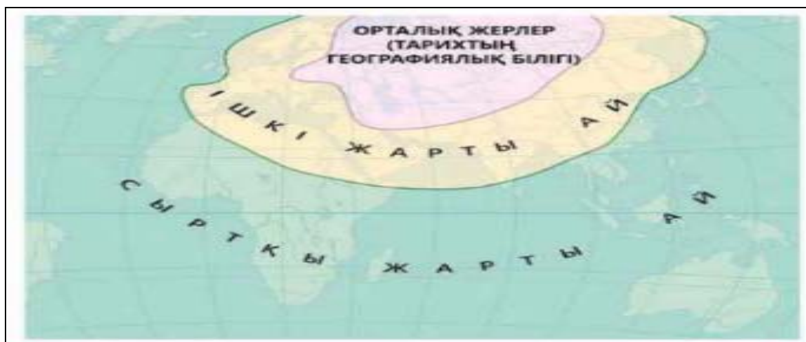
Сурет 5. С.Коэннің геосаяси аудандастыруы

Сонымен қатар осы тақырыпта оқушыларға «хартленд», «ішкі жарты ай», «сыртқы жарты ай», «геостратегиялық облыс» сынды глоссарийге ұғымдар берген. Бұл тақырыпта геосаяси теориялар оқушылар үшін тым қызықсыз және түсініксіз болып көрінеді. Тіпті оқулықта америкалық геосаясатшы С.Коэннің геосаяси аудандастыру бойынша әлемнің «көп полюстілігі» туралы анағұрлым күрделі геосаяси үлгісін ұсынады (сурет 5) [9].