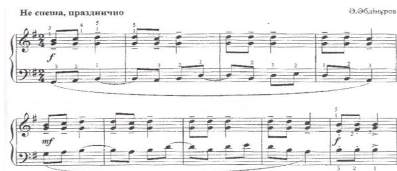
Ә. Әбдіұровтың «Бесік той» пьесасы

циялық қабілеттерін, музыкалық қабілеттерін және қиялын дамытуға бағытталған. «Рождение (Бесік той)» пьесасы мерекелік, салтанатты сипатқа ие және жаңа өмірдің басталуына байланысты көтеріңкі, қуанышты көңіл-күйді береді.