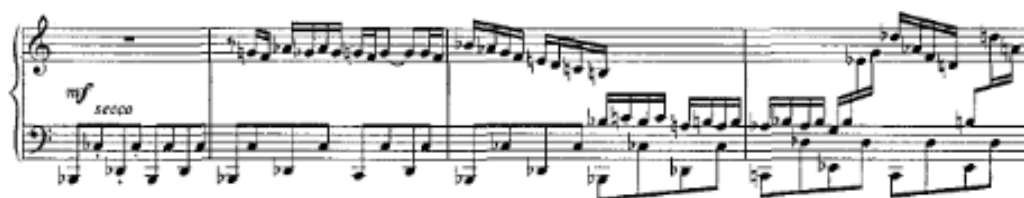
Т. Қажығалиевтің фортепианоға арналған №2 концерті

Негізгі партияның тақырыбын қайталау октавалық дыбыстауда естіледі. Байланыстырушы партия остинаттылықпен сипатталады, ол кейіннен тақырыптық дамудың өзегіне айналады. Жанама партия қозғалыс толқындылығымен және солист пен оркестр партиясындағы белсенді ырғақтық фигурамен ерекшеленеді.