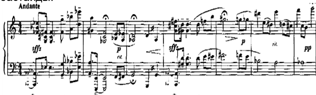
С. Еркімбековтің фортепианоға арналған концерті. Кіріспе

Кіріспе импровизациялық сипатқа ие және хроматизмдер мен аккордтық кешендерден тұрады, белсенді ырғақты сурет, контрастық динамика бар. Концерттің кіріспесі маңызды рөл атқарады, себебі келесі бөлімге бастайды.