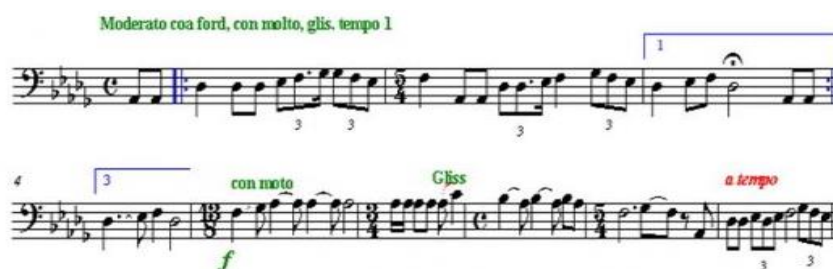
Б. Баянұновтың «Кіріспе» пьесасы

Бірінші «Кіріспе» пьесасы үш бөлікті түрде жазылған. «Қозы Көрпеш – Баян Сұлу» эпикалық ертегісінің әуенін естігенде виолончельдің алғашқы сөзі «Қозы Көрпеш-Баян Сұлу» эпикалық ертегісінің әуенін бейнелейді. Бұл әуен қыл қобыз тембріне ұқсайтын тембрлік тұрғыда жетеді.