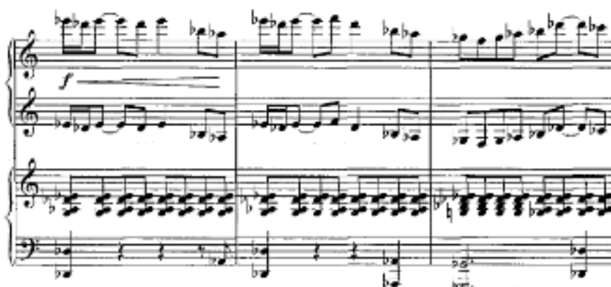
Т. Қажығалиевтің фортепианоға арналған №2 концерті. Негізгі партия

Негізгі партияның тақырыбын қайталау октавалық дыбыстауда естіледі. Байланыстырушы партия остинаттылықпен сипатталады, ол кейіннен тақырыптық дамудың өзегіне айналады. Жанама партия қозғалыс толқындылығымен және солист пен оркестр партиясындағы белсенді ырғақтық фигурамен ерекшеленеді.