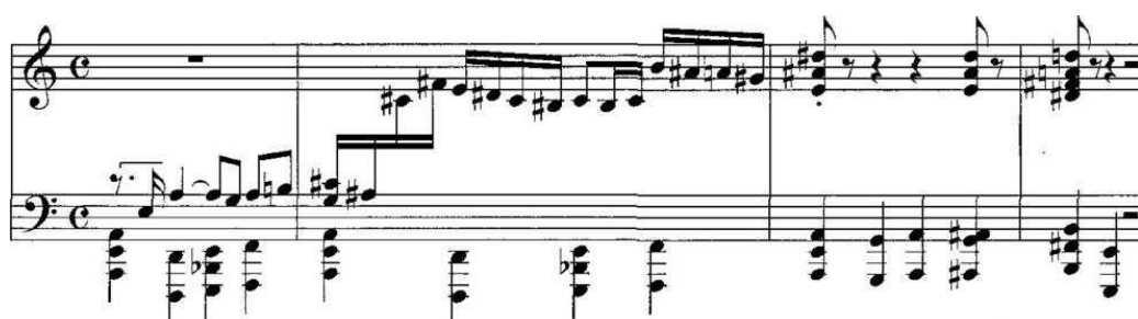
А. Серкебаевтың фортепиано до минорға арналған сонатасы

Күйдің бейнелі мағынасында, форманың қалыптасуында көрсетудің жарқын мысалы А. Серкебаевтың фортепиано до минорға арналған сонатасының финалы болуы мүмкін. Шығарманың формасы толық симфонизацияланған күй ретінде қарастыруға болады, оның негізінде қазақ күйлерінің стилінде ұстанған айқын тақырып жатыр. Соната финалының композициясы келесі түрде көрінеді: рефрен (А) негізінде-Құрманғазы күйлерінің жігерлі бейнелеріне тән жарқын серпінді тақырып. Бұл-шығарманың басты тақырыптық буыны, демек, финалдың басты тақырыбы. Рефрен ұлттық дүниетанымның музыкалық көрінісінде қозғалыс динамикасын көрсетеді. Бірінші эпизод рондо-сонаталар күйдің орташа бөлімі ретінде қабылданады. Рефренді қайтару негізгі тақырыптық мотивінің пайда болуын білдіреді. Шабыс бейнесі финал тақырыбына ерекше ұлттық нақыштарды береді. А.Серкебаевтың фортепианолық сонатаның финалындакүймен дәстүрлі ұқсастығы бар: бейнелік, баяндау фактурасы, тақырыптық даму, композициялық жоспар. А.Серкебаевтың сонатасы-күйдің дамуы мен еуропалық форма құрастыру принциптерінің өзара енуінің сәтті мысалы.