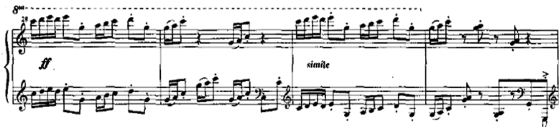
С. Еркімбековтің концерті. Негізгі партия

Бірінші бөлімнің негізгі партиясында автор қазақ халқының «Сарымойын» әнінің әуенін пайдаланды. Бұл тақырып оптимистік сипатқа ие, би белгілері бар.