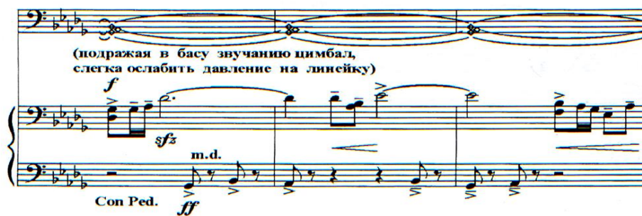
Б. Баяхуновтың №2 сонатасы

2-бөлімнің мазмұны негізіне тарихи оқиғалар кіреді: атап айтқанда, 1860-1870 жылдардағы жеңіліспен аяқталған Қытайдағы дүнген көтерілісі. Бұл бөлімде автор түрлі техникалық тәсілдерді қолданады: халық дыбысын имитациялау, бас ішектер бойынша глиссандо сызғышымен, полиметриялық үйлесім, аккордтарды алақанмен орындау.