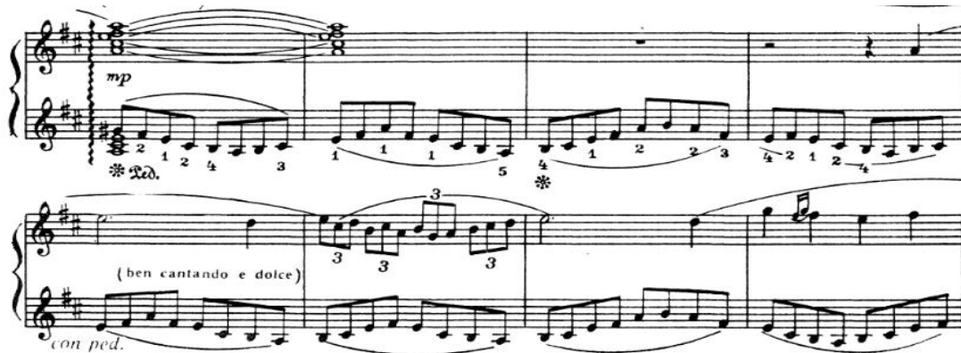
К. Дүйсекеевтің сонатасы

Сонатаның негізгі тақырыптарын дамыту барысында автор әртүрлі полифония түрлерін аккорд мазмұндамасымен ұштастыра отырып, әртүрлі ырғақты фигурациялар, әртүрлі музыкалық-мәнерлі құралдарды қолданады.