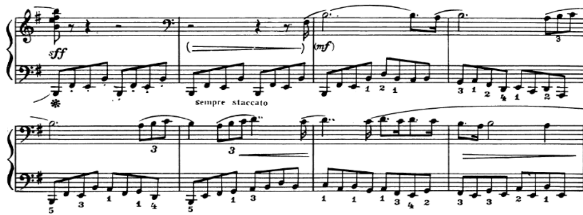
К. Дүйсекеевтің сонатасы. Орта бөлім. Басты партия

Сонатаның негізгі тақырыптарын дамыту барысында автор әртүрлі полифония түрлерін аккорд мазмұндамасымен ұштастыра отырып, әртүрлі ырғақты фигурациялар, әртүрлі музыкалық-мәнерлі құралдарды қолданады.