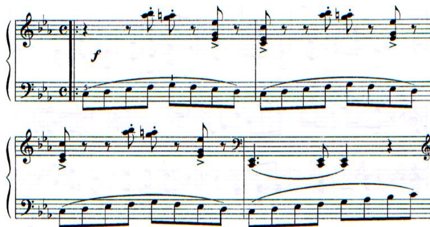
А. Мәмбетовтің«Мәңгі қозғалыс» пьесасы

Композитор А.А. Мәмбетовтің «Мәңгі қозғалыс» («Непрерывное движение») виртуоздық сипатындағы пьесасы 2004 жылы жазылған. Бұл «Жастық шақтың 6 пьесасы» фортепианолық циклдің туындыларының бірі. Пьеса балалар фортепиано миниатюрасының жанрына жатады және 2 бөліктен тұрады. Пьесаның сипатымотор жәнеүздіксіз қозғалысты құрайтын өрлемелі және азаймалы гамма образды пассаждармен сүйемелденеді.