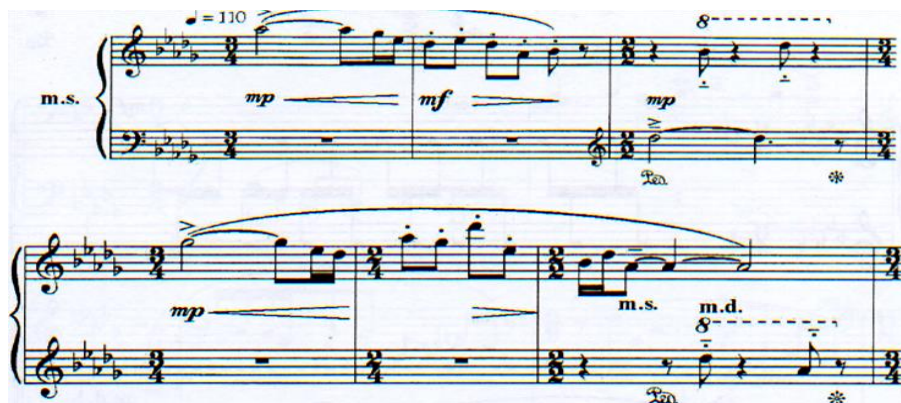
Б. Баяхуновтың №2 сонатасы

2-бөлімнің мазмұны негізіне тарихи оқиғалар кіреді: атап айтқанда, 1860-1870 жылдардағы жеңіліспен аяқталған Қытайдағы дүнген көтерілісі. Бұл бөлімде автор түрлі техникалық тәсілдерді қолданады: халық дыбысын имитациялау, бас ішектер бойынша глиссандо сызғышымен, полиметриялық үйлесім, аккордтарды алақанмен орындау.