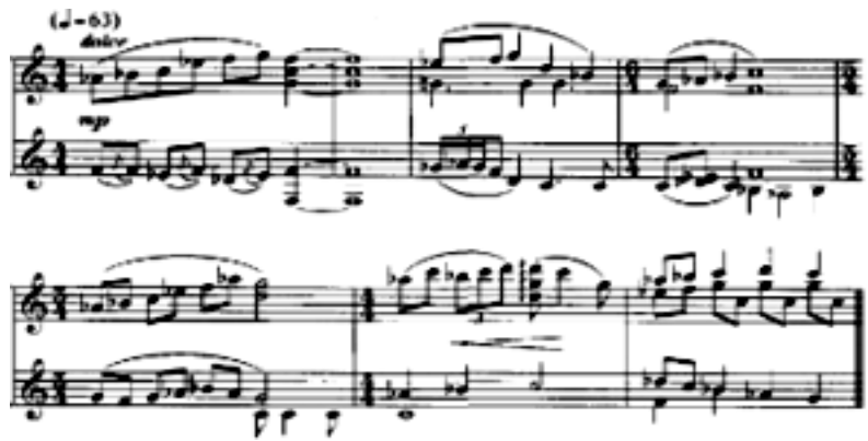
А.Сағатовтың фортепианоға арналған концерті.Жанама партия

Екінші бөлімде фактуралық мазмұндама өзгереді. Үшінші бөлімде қазақтың дәстүрлі аспаптық музыкасының монодиялық негізі көрсетілген. Репетицияның жетекші бөлігінде домбыра дыбысы беріледі. Концерттің төртінші бөлімі шарықтау шегі болып табылады. Концерт оркестрдің күрделі tutti-мен аяқталады.