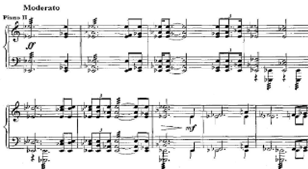
Т. Қажығалиевтің фортепианоға арналған №2 концерті. Әзірleme

Әзірleme екі эпизодтан – күйден және лирикалық бөлімнен тұрады. Күй бөлімі әзірleme менің шарықтау шегі болып табылады және бүкіл концерттің драматургиясында маңызды мағынаға ие.