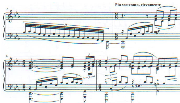
Ө.Толықпаевтың «Япурай» туындысы

еркіндігімен ерекшеленеді. Шығарма С. Рахманинов стилінде жазылған: ән фортепиано монументализммен, романтикалық қуатпен, пассаждың асқан шеберлігімен және белсенді ырғақпен үйлеседі.