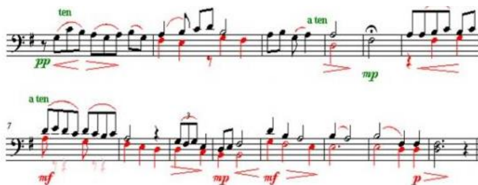
Б. Аманжоловтың «Рисунки» пьесасы

Кіріспе кеңістік сезімімен өте еркін естіледі. Орындаушыға «оқуды жеделдету және бәсеңдету» түрінде «баяу домбыра тарту рухында ойнау» авторының ұсынымдары беріледі. Шығармада екі жолақты мазмұндауға байланысты техникалық қиындықтар көп. Әрбір дауыс ерекше тембрі мен әуен тереңдігінің ішкі сезіміне ие (мысалды қараңыз).