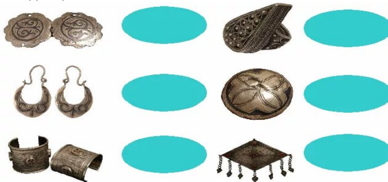
Сурет 2 – Зергерлік әшекей бұйымдар

Тапсырма: Төмендегі суреттерге қарап, тұсына атауларын жаз. Пішіндеріне қарай, жасалу жолдары жайында әңгімеле.