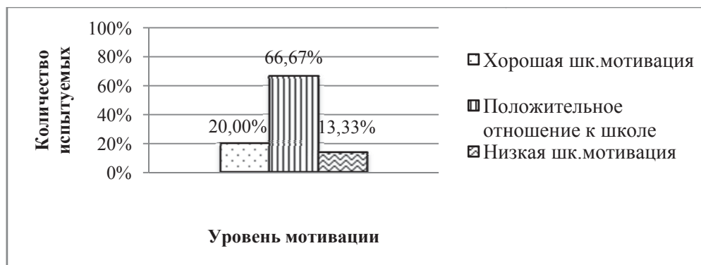
Рисунок 2. Результаты исследования по методике «Оценка школьной мотивации» по Н.Г. Лускановой

Результаты исследования по методике «Оценка школьной мотивации» по Н.Г. Лускановой представлены на рисунке 2.