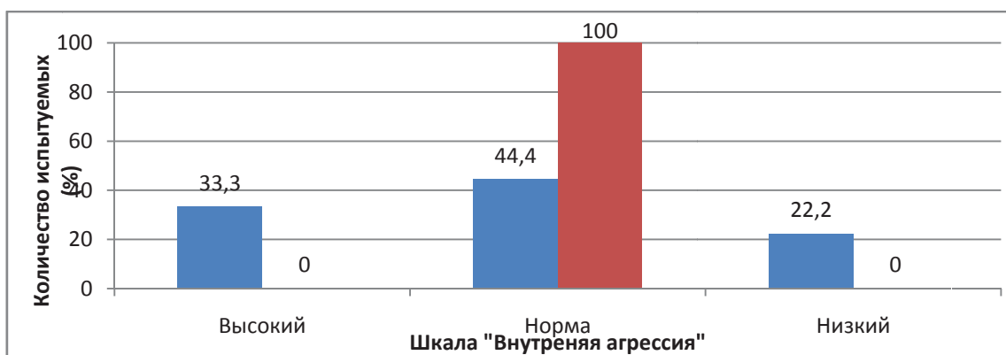
Рисунок 2 – Результаты исследования внутренней (скрытой) агрессивности по методике С. Дайхофф (S. Dayhoff)

Результаты тестирования внутренней (скрытой) агрессивности по методике С. Дайхофф (S. Dayhoff) представлены на рисунке 2.