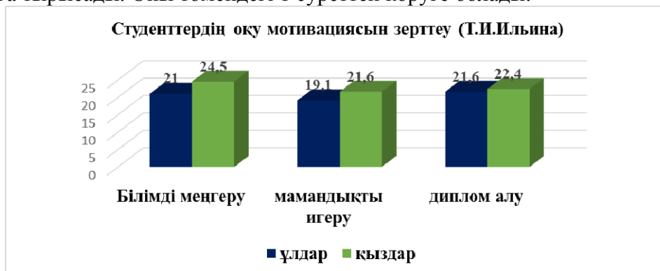
Сурет 1. Студенттердің оқу мотивациясын зерттеу (Т.И.Ильина)

«Студенттердің оқу мотивациясын зерттеу» (Т.И. Ильина) әдістемесі студенттердің «білімді меңгеру», «мамандықты игеру», «диплом алу» шкалалары бойынша оқу-танымдық белсенділіктерін анықтауға мүмкіндік береді. Студенттердің берген жауаптарын гендерлік ерекшеліктері бойынша салыстырмалы талдау нәтижесінде «білімді меңгеру», «мамандықты игеру» шкалалары бойынша қыздардың көрсеткіштері жоғары болды. Олай болса, білім алуға ұмтылу, кәсіби білімге қызығушылық таныту, кәсіби білімді игеруге және болашақ кәсібіне сәйкес маңызды қасиеттерді қалыптастыруға ұмтылу қыздарда ұлдарға қарағанда басымырақ болды. Қыздар өздерінің болашақ мамандықтарына, кәсіби дайындығына жауапкершілік танытады, дегенмен, кейбір студенттердің берген жауаптары өте жоғары оқу мотивациясын байқатса, енді біреулерінің көрсеткіштері орташа диапазонда орналасты. Сондықтанда зерттеу жұмысына енген барлық қыздардың оқу мотивациясы жоғары деп айтуға болмайды. «Диплом алу» шкаласы бойынша ұлдар мен қыздардың көрсеткіштері арасындағы айырмашылық шамалы, яғни зерттеу тобындағы студенттер жоғарғы оқу орнын аяқтап, диплом алуға тырысады. Оны төмендегі 1 суреттен көруге болады: